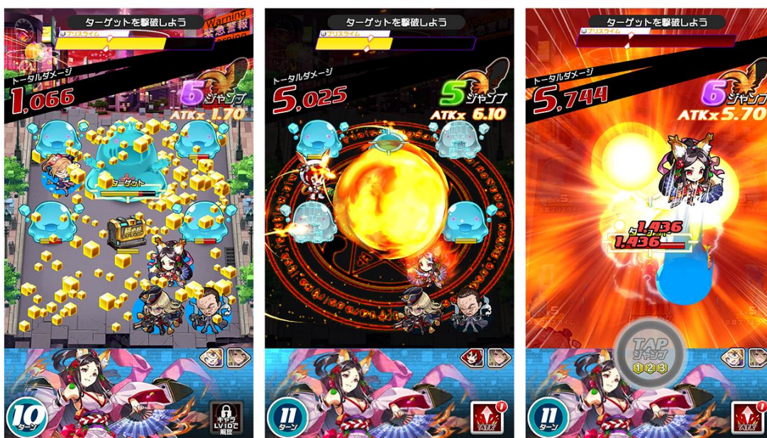
※画像は開発中のものです、実際の画面とは異なる場合があります