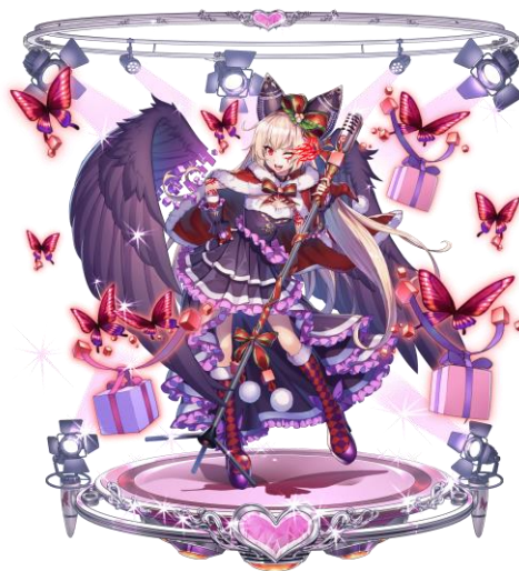
★5 クリスマス ノイル(CV: 喜多村 英梨)