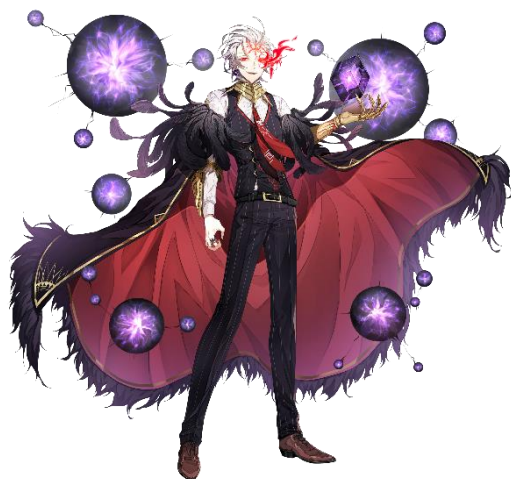
★5 漆黒の王 カウス (CV: 中村 悠一)