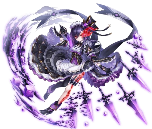
★5 劇毒のカルネシア (CV: 水瀬 いのり)