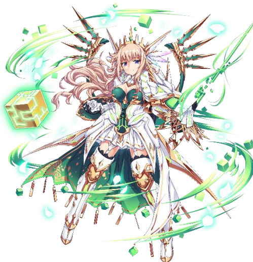
★5 創造主 サルバドール(CV: 花江 夏樹) ★5 守護者 ミュール(CV: 佐藤 利奈)