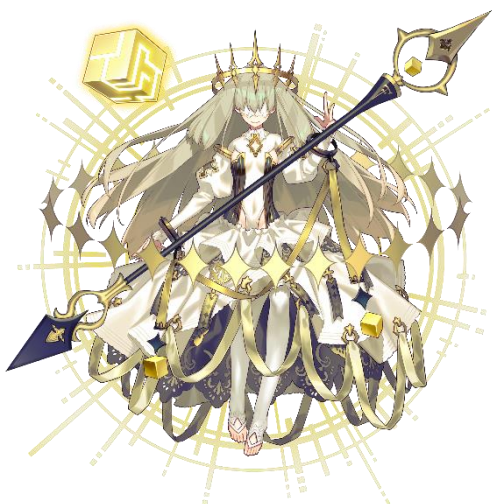
★5 再生のエルツティナ(CV: 堀江 由衣)