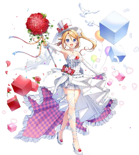
★5 ブライダル リオ (CV: 下地 紫野さん)