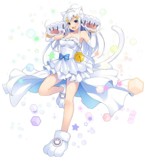
★5 はにやよめ フェレス (CV: 阿澄 佳奈さん)