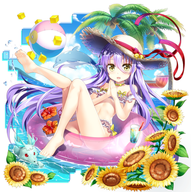
★5 波打ち際の妖精マリアンヌ(CV: 日高 里菜)