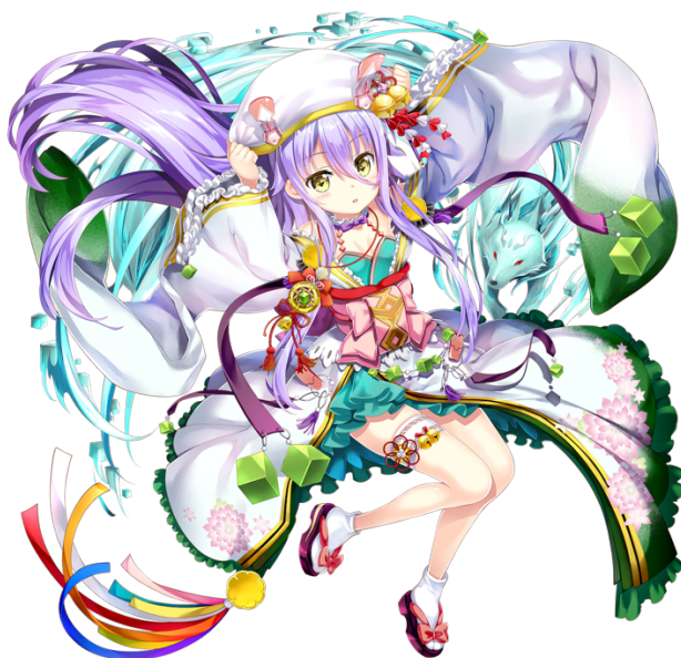
★5 奇跡の聖女マリアンヌ(CV: 日高 里菜)