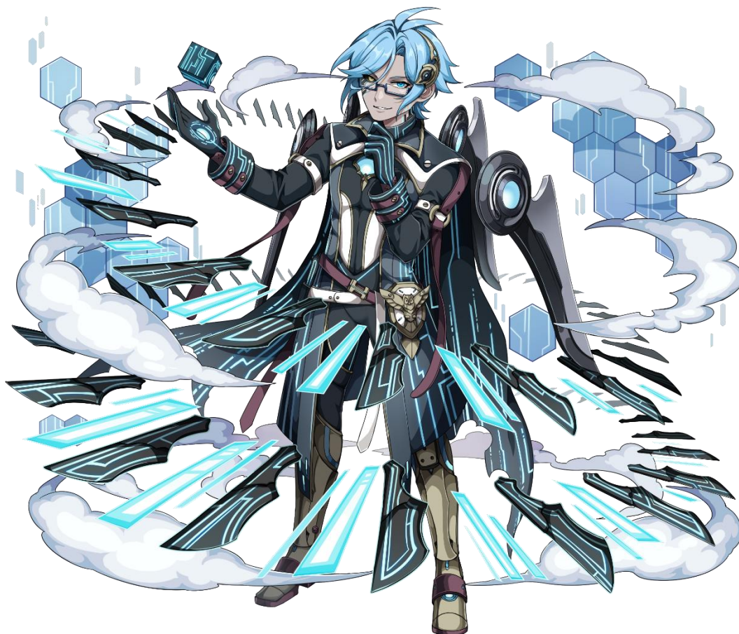
【★6 反逆の七賢人オレア】