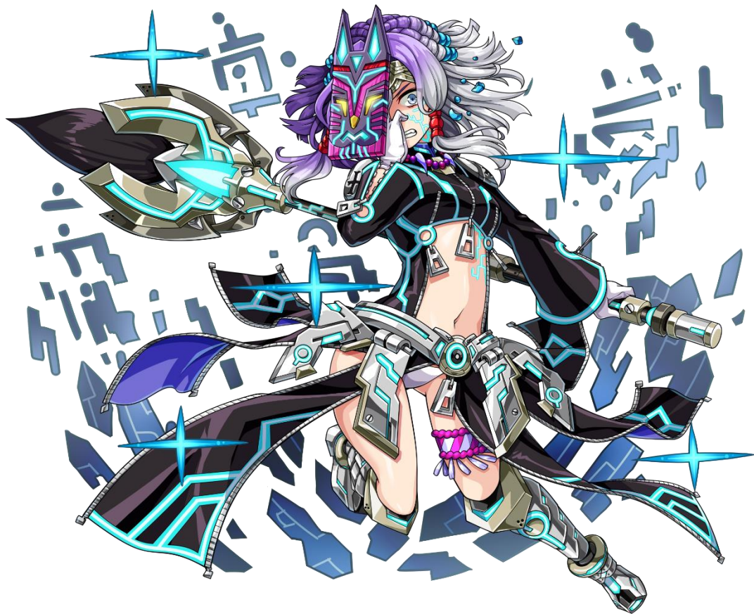
【★5 反逆の七賢人ライラック】