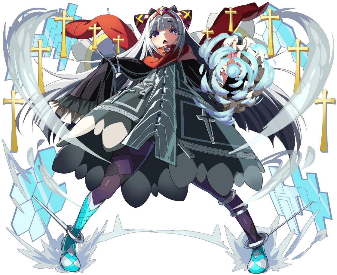
【★6 反逆の七賢人アルストロメリア】