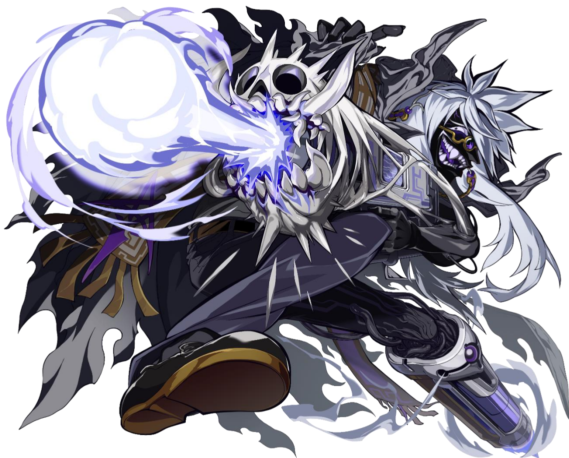
【★5 無の七賢人アスター】