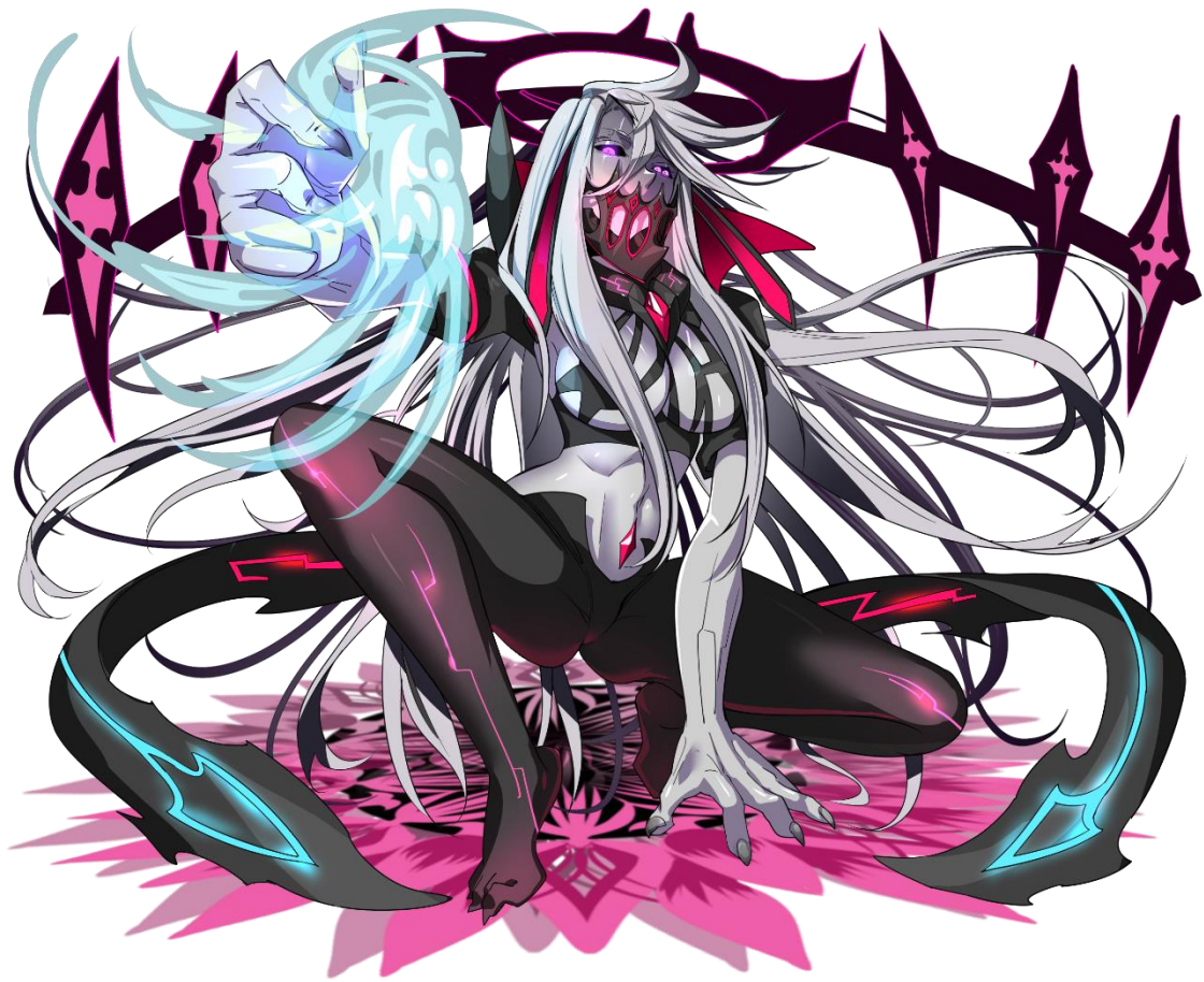
【★6 無の七賢人ガーベラ】