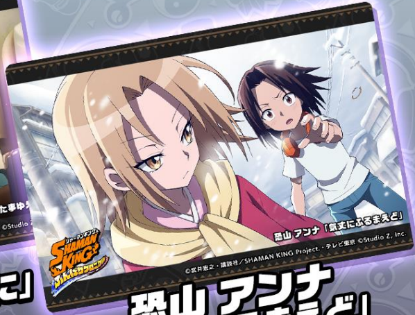
恐山アノナ 「気丈にふるまえど」