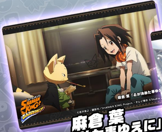
麻倉葉 「元が決めた事ゆえに」